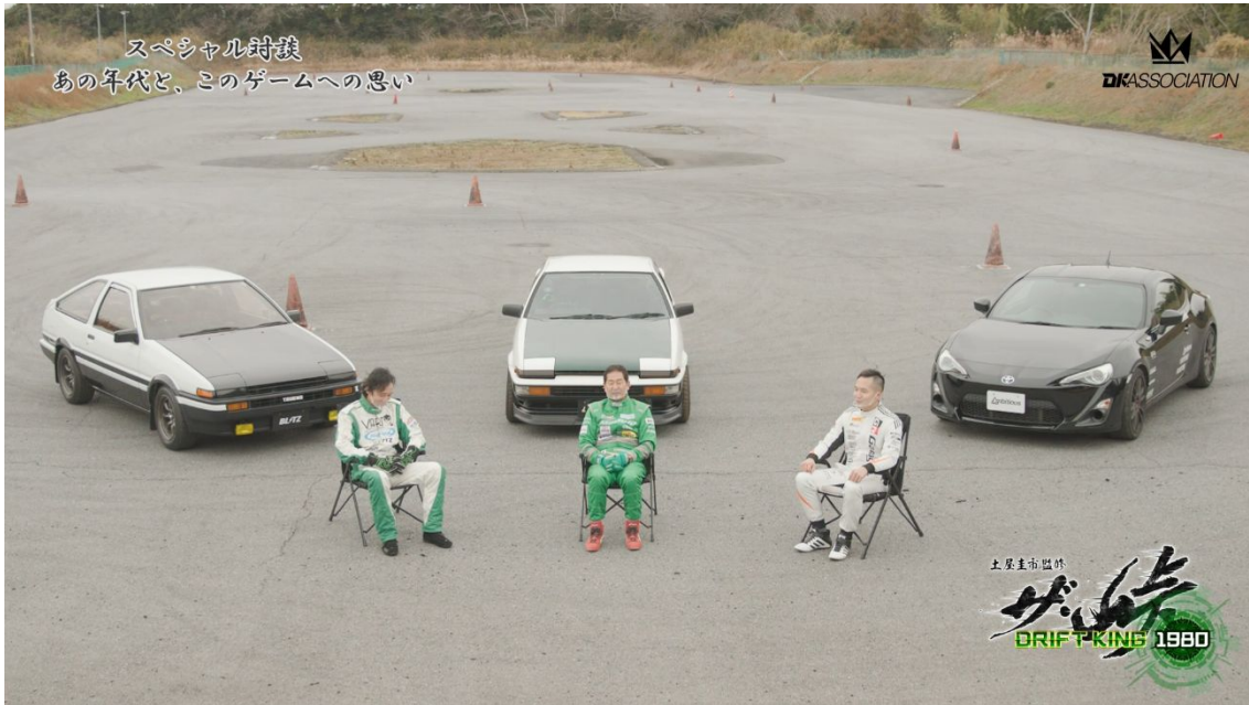
▲ザ・峠 ～DRIFT KING 1980～ —スペシャル対談— 前編より抜粋 ※画像は全て開発中のものです